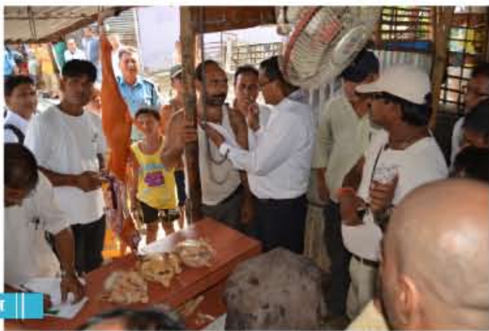
भैरहवाका मासु पसलहरूको अनुगमन गर्दै जिल्ला अनुगमन समितिका प्रतिनिधिहरू ।

जिल्ला अनुगमन समिति रूपन्देहीले मंगलबार मासु पसलहरूको अनुगमन गरेको छ । चाडपर्वको मुखमा गरिने यो अनुगमन देशवर्दी मात्र भागको र आफूलाई केही राहत नहुने उपभोक्ताहरूले आरोप लगाएका छन् । यो बेला कतिपय बढी हुने र व्यापारीहरूले खसलेन गर्ने उपभोक्ताहरूको गुनासो रहने हुदा जिल्ला पशु सेवा कार्यालयको अगुवाइमा मासु पसलहरूको अनुगमन गरेको जिल्ला पशु सेवा कार्यालयका कार्यालय प्रमुख