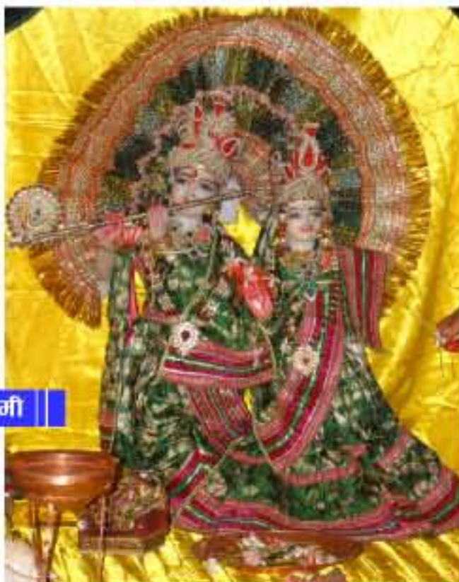
भैरहवास्थित राधाकृष्ण मन्दिर भित्र रहेको मुर्ती ।